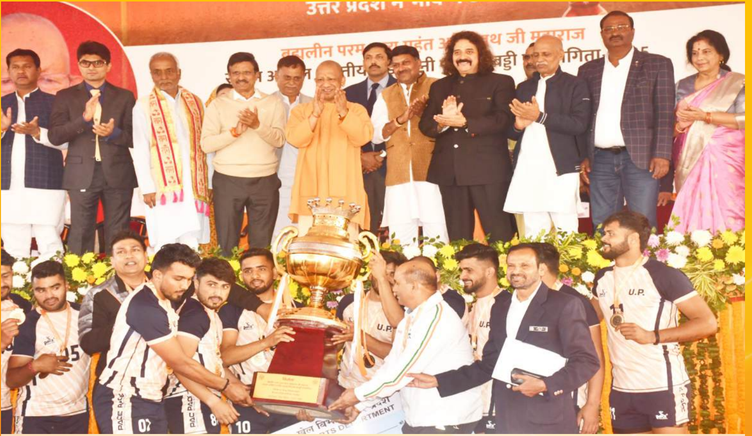
ब्रह्मलीन परमपूज्य महन्त श्री अवैद्यनाथ श्री महाराज अखिल भारतीय आमंत्रण प्राइजमनी कबड्डी पुरुष प्रतियोगिता