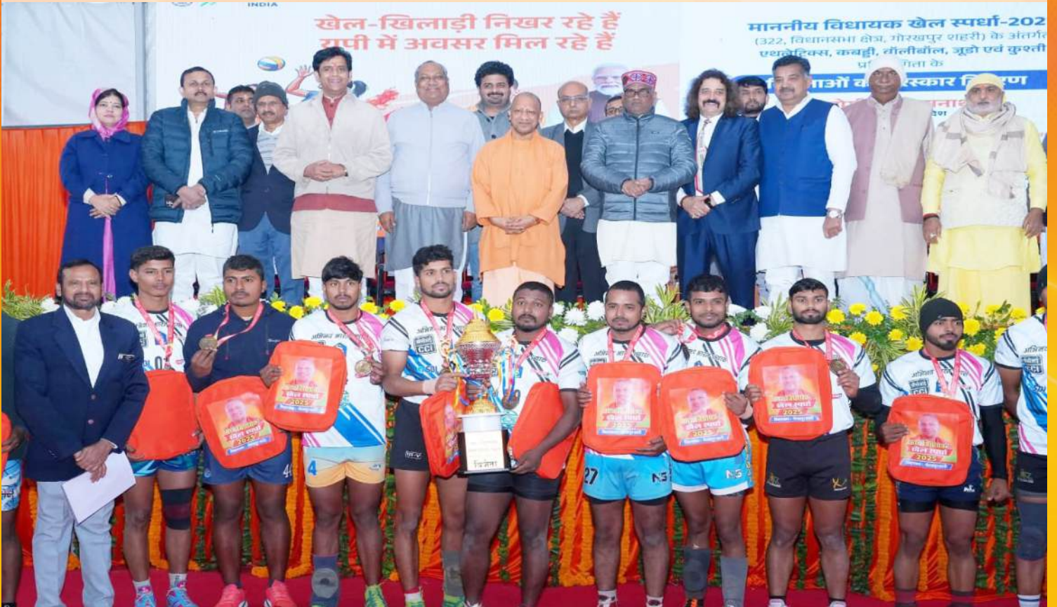
जनपद गोरखपुर में आयोजित विधायक खेल स्पर्धा